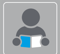
Qualifikations- und Weiterbildungsmöglichkeiten

* Hautfarbe, Herkunft oder Geschlecht spielen für uns keine Rolle. Hauptsache Sie passen in unser Team und Ihre Motivation stimmt.