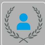
Prämien bei Jubiläen