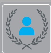
Prämien bei Jubiläen